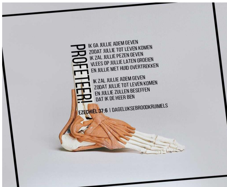
Ezechiël 37 de verzen 4 t/m 6

Z O N D A G 26 maart 2023 5 e zondag van de 40 dagen